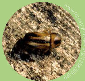
Kleiner Käfer, Größe: 2,8–4,8 mm