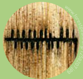
Typisch: Brutgänge in Leiterform mit Holzverfärbung