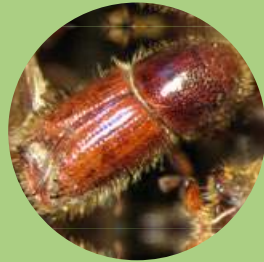
Größe 4–5,5 mm