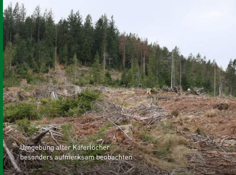
Umgebung alter Käferlöcher besonders aufmerksam beobachten

Bei akuter Gefährdung durch Kupferstecher ist zusätzlich das Hacken oder kontrollierte Verbrennen (Landeswaldgesetz beachten!) des schwachen Materials zu überlegen. Aus Gründen der Nährstoffnachhaltigkeit wird empfohlen, das Hackmaterial zurück in den Bestand zu verblasen.