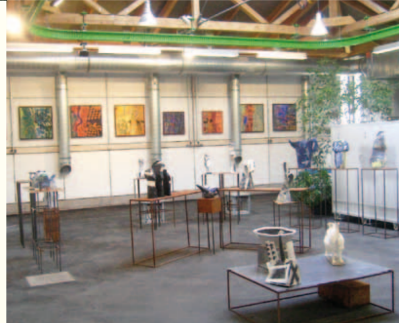
Kunst in der Klenge

Bei zahlreichen Führungen wird dieser ganz spezielle Aspekt der Waldwirtschaft Besuchergruppen von Schulklassen, über Vereine, forstliche Gruppen bis hin zu ausländischen Gästen nahe gebracht. Gerne nutzt die Klenge auch bei verschiedenen Veranstaltungen die Gelegenheit, den Betrieb der Öffentlichkeit vorzustellen.